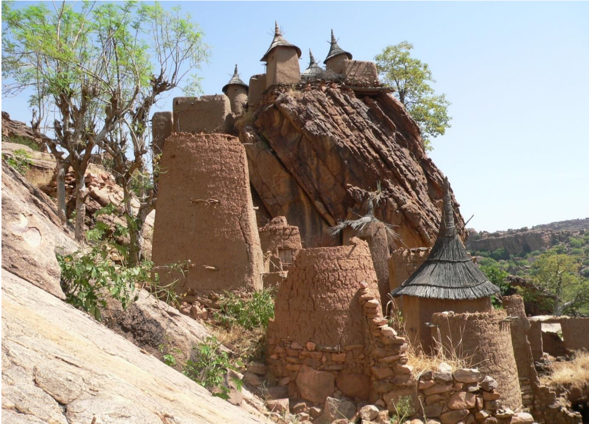
Figure 1: Architecture de Yandouma-Ato