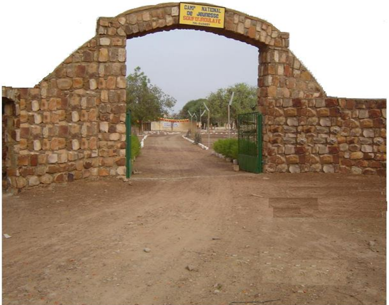
Figure 8: Paysage de la porte d'entrée du Camp National de Jeunesse de Soufroulaye