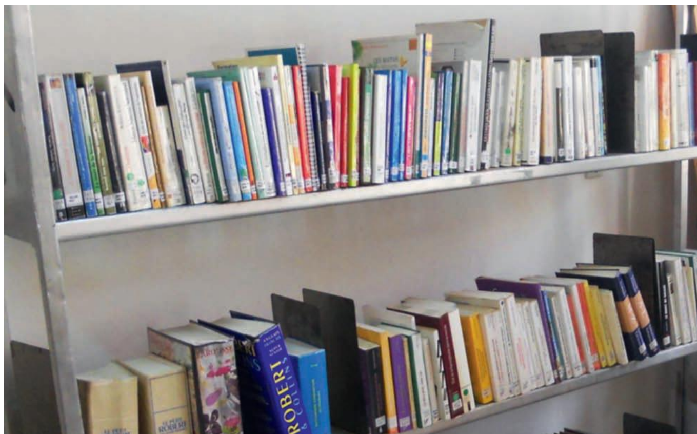
Figure 5: Rayons de la Médiathèque du Centre National de Lecture Publique