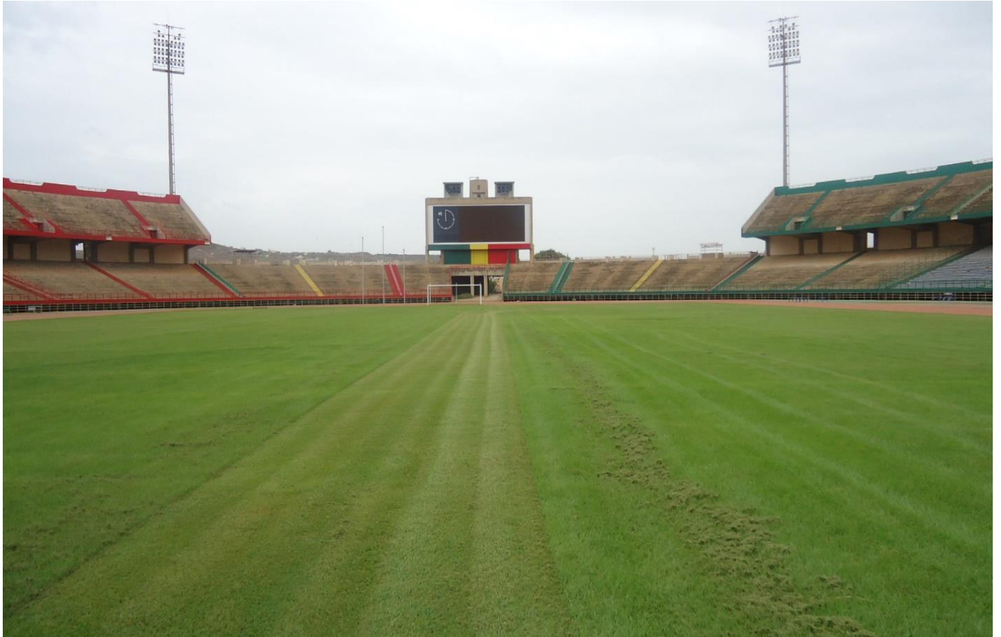
Figure 9: Pelouse du Stade 26 Mars