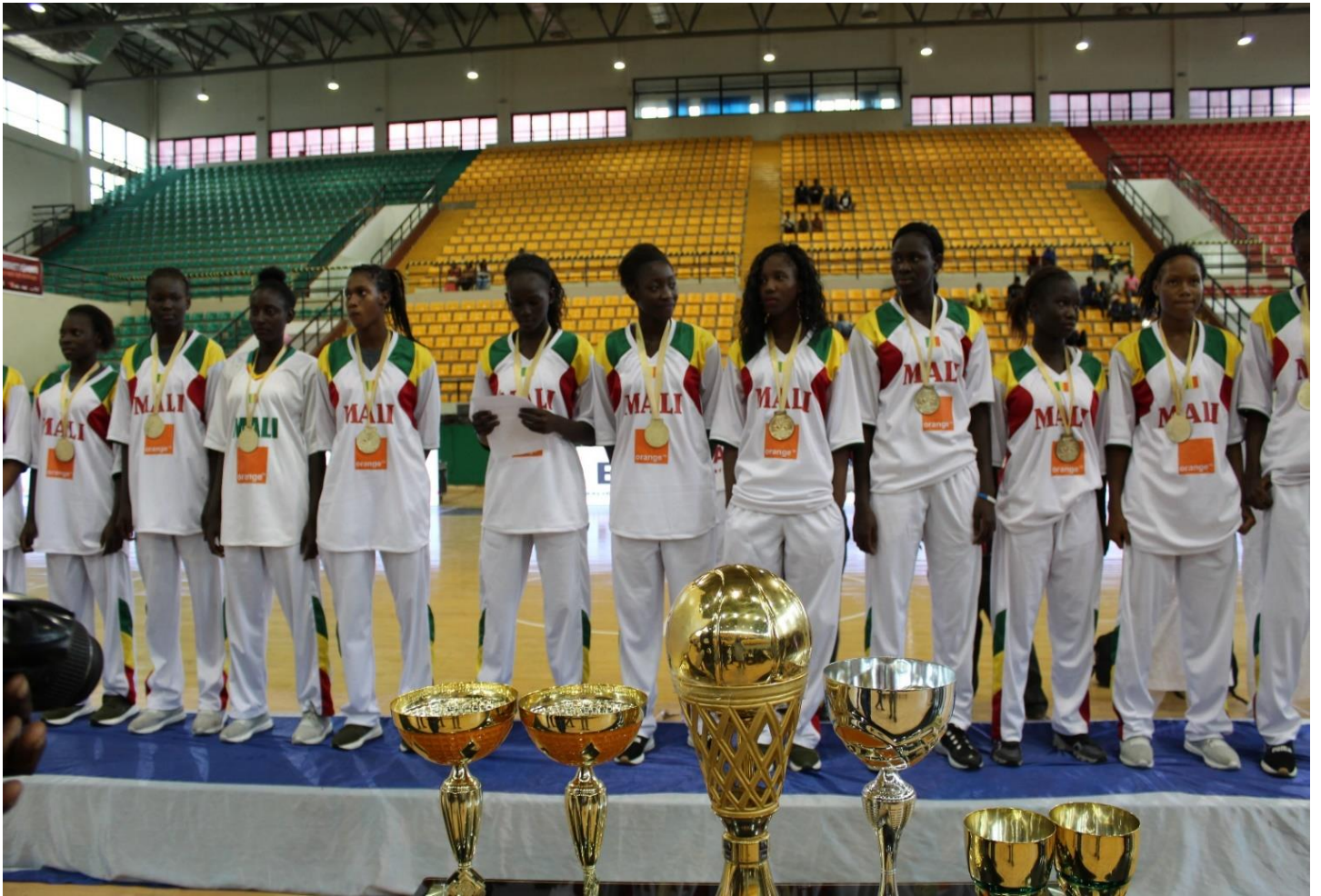
Figure 10: Equipe Championne U-16 Filles 2017 de Basket-ball au Mozambique