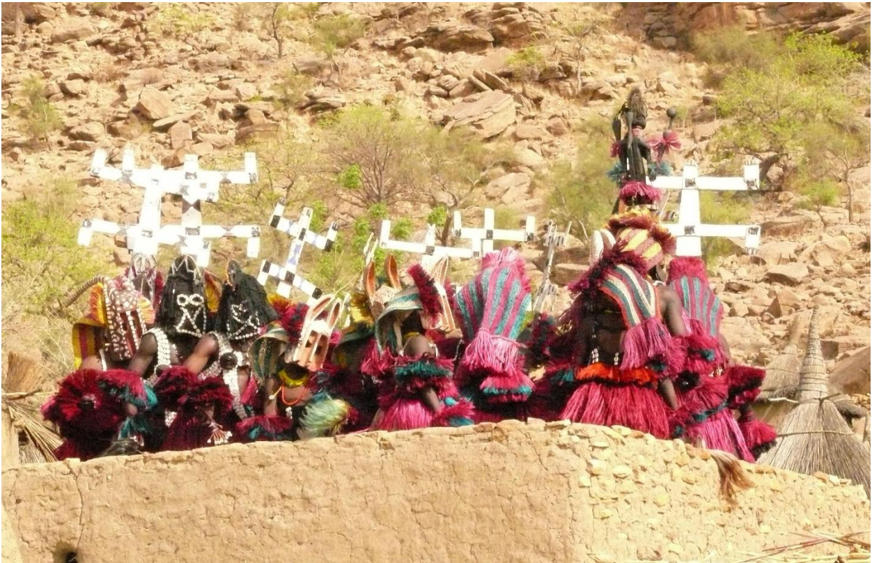
Figure 3: Funérailles Téréli3