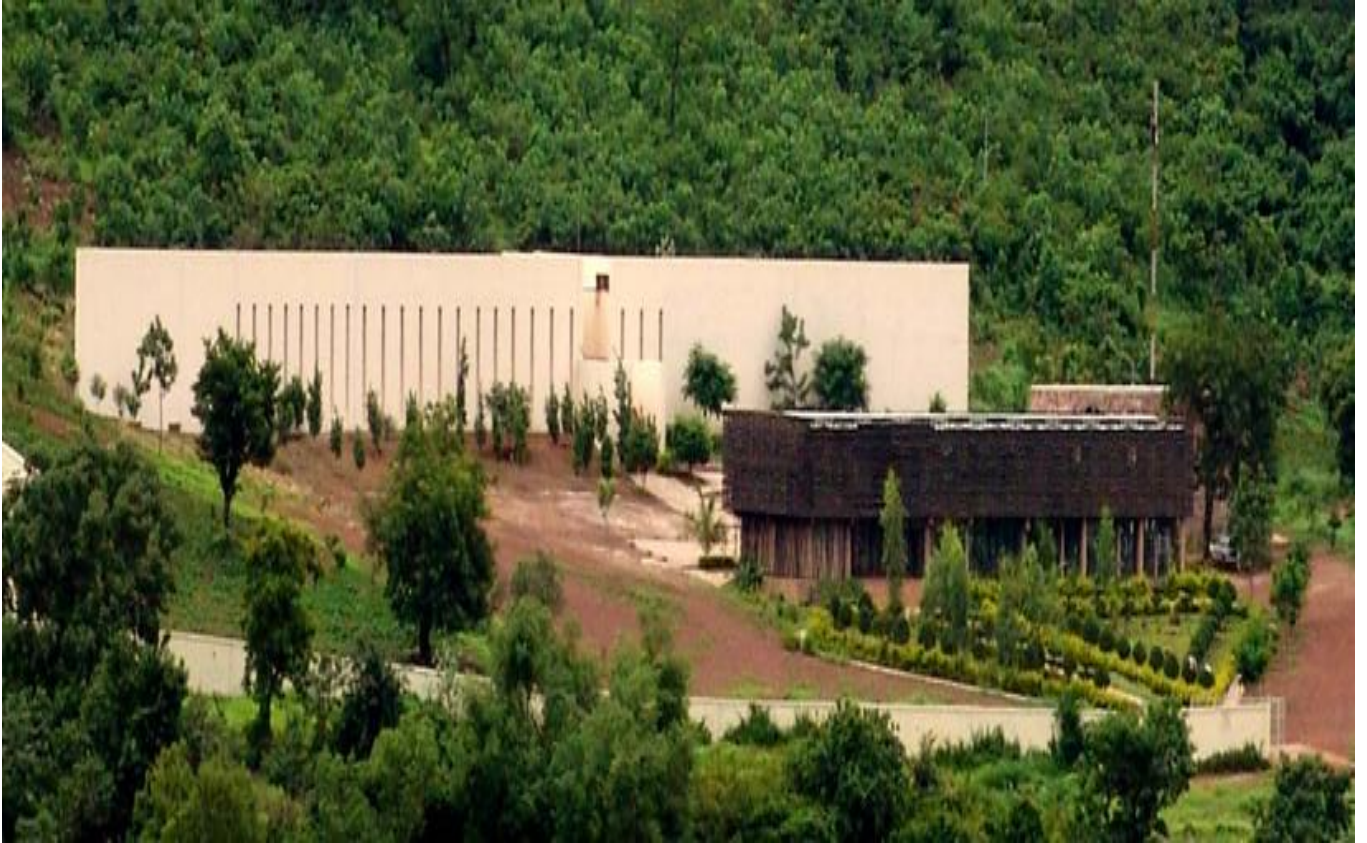
Figure 7: Conservatoire des Arts et Métiers Multimédia balla Fasseké KOUYATE