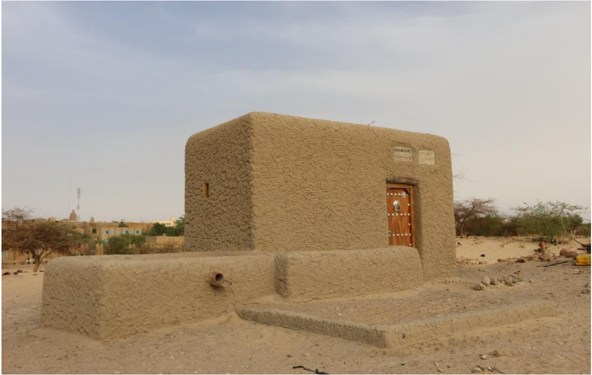
Figure 2: Mausolée Cheick Sidi Ben Amar Arragadi, Tombouctou