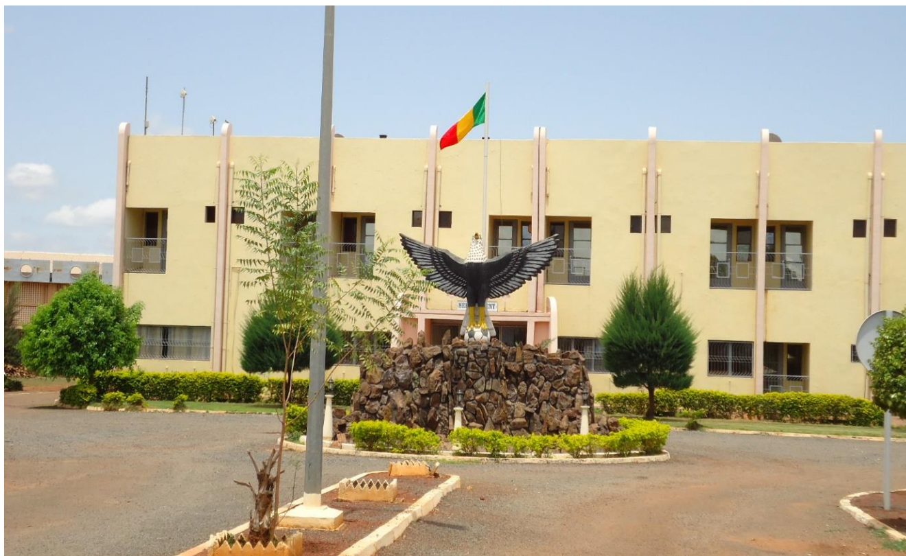
Figure 11: Centre d'Entraînement pour Sportif d'Elite Ousmane TRAORE dit « Ousmane Bleni » de Kabala